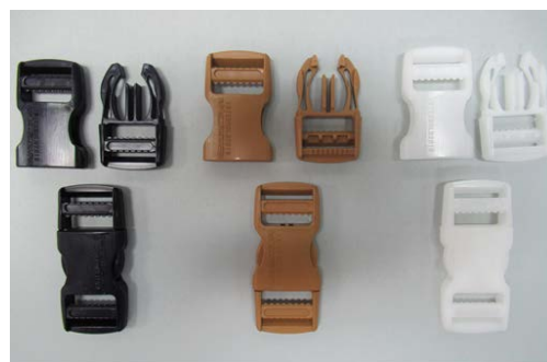
プラスチック用金型部門課題