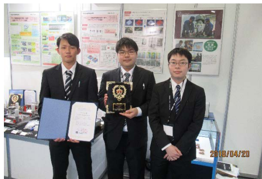
銀賞賞授（プラスチック用金型部門メンバー）

【お問い合わせ先】 大分県立工科短期大学校 TEL：0979-23-5500 FAX：0979-23-7001