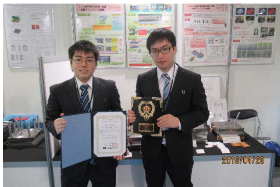
銀賞賞授（プレス用金型部門メンバー）